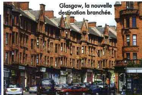
Glasgow, la nouvelle destination branchée.