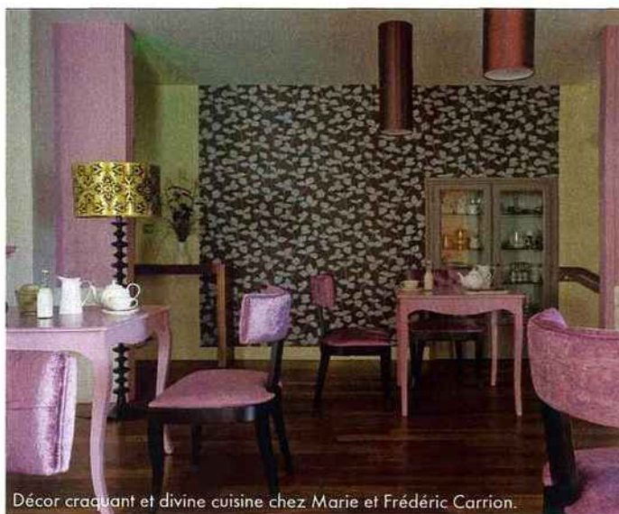
Décor craquant et divine cuisine chez Marie et Frédéric Carrion.

Séjour Evasion dans les vignes, spécial lectrices de ELLE : pour 2 personnes, 4 jours/3 nuits + petits déjeuners + 2 dîners + 1 panier chic déjeuner ou dîner + visite des vignes + balade à vélo + circuit des églises romanes ou route des lavoirs + soins du corps = 1 000 €.