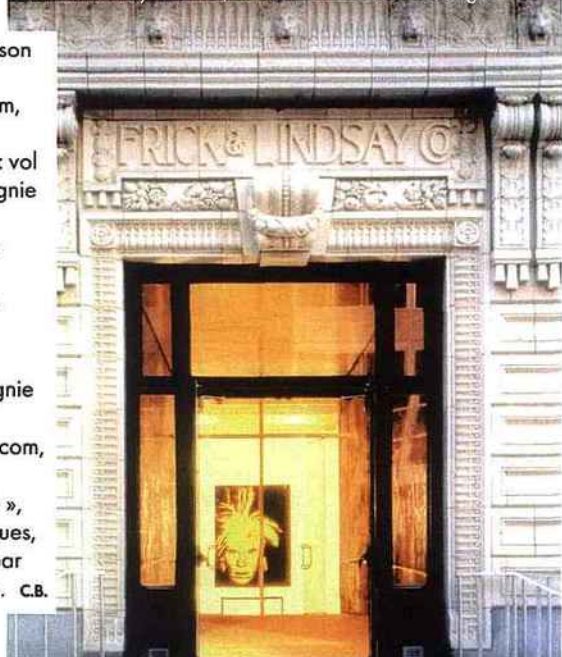
Le musée Andy Warhol, l'enfant terrible de Pittsburgh.

« Week-end arty à Pittsburgh », avec les mêmes caractéristiques, proposé à partir de 749 € par personne jusqu'au 31 octobre. C.B.