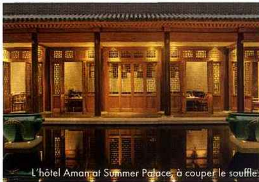
L'hôtel Aman at Summer Palace, à couper le souffle.

Infos et réservations : Amanresorts et Voyageurs en Chine ( www.amanresorts.com et www.vdm.com , tél. : 0 892 23 79 79) proposent un package spécial lectrices de ELLE : vol Paris/Pékin sur la compagnie Air China + transferts + 3 nuits à l'Aman at Summer Palace + petits déjeuners + 1 massage traditionnel chinois de 90 mn à l'Aman Spa + 1 dîner impérial = 2 650 € par personne.