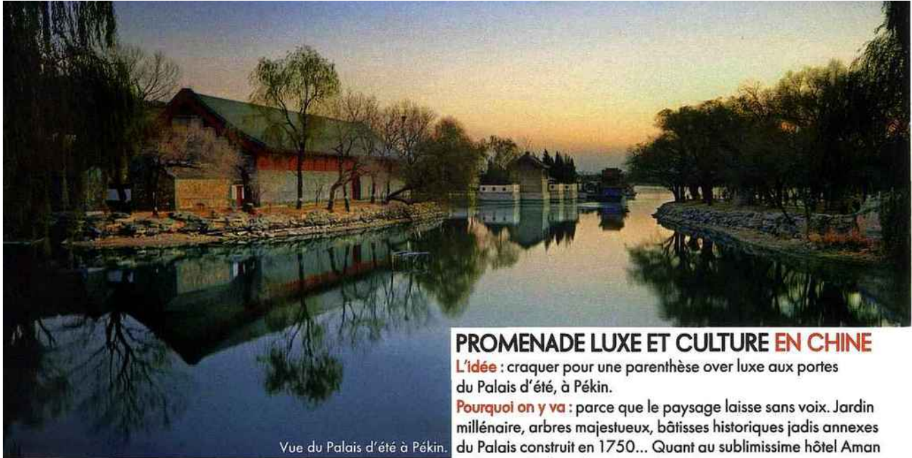
Vue du Palais d'été à Pékin.