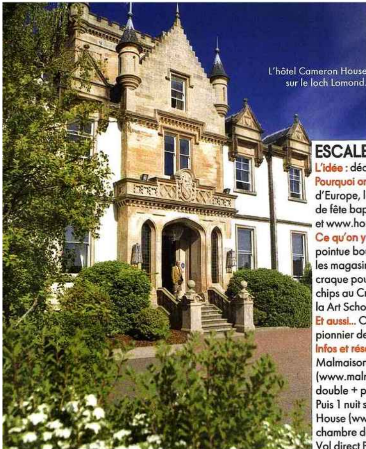
L'hôtel Cameron House sur le loch Lomond.