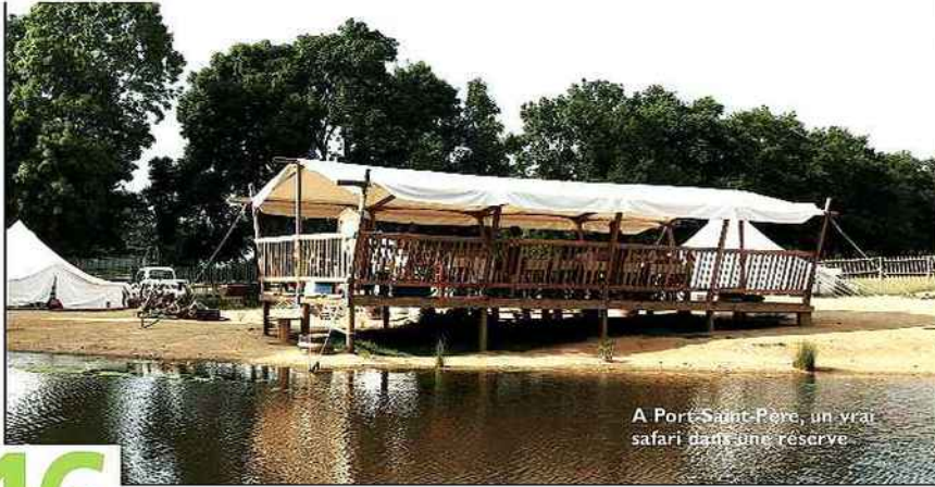
A Port-Saint-Père, un vrai safari dans une réserve

Dans des arbres, des grottes, des filets ou en roulotte, des week-ends pour les parents et les enfants