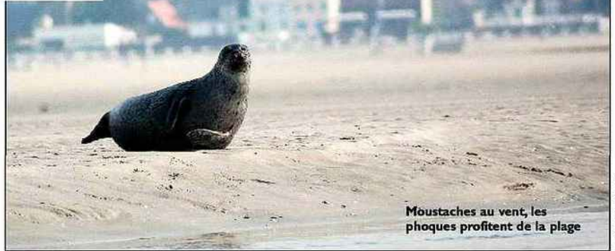
Moustaches au vent, les phoques profitent de la plage

Jusqu'en juin, le ballet est incessant. Les migrants reviennent dans la baie, entre Saint-Valery-sur-Somme et Le Crottoy : cigognes, oies cendrées, hérons, aigrettes garzettes, rapaces, pique-bœufs, martins-pêcheurs. La Somme célèbre jusqu'au 26 avril le retour des 344 espèces par un Festival des Oiseaux avec films et ateliers. Mais rien ne vaut le vécu. Direction le Marquenterre, parc ornithologique où, suivant les guides naturalistes, nous assistons aux parades, couvaisons, naissances, échauffourées en vol au-dessus des nids. Les ritournelles, chants nuptiaux, débordent les frontières du Marquenterre. Vers les confins sauvages de la baie, les calèches du parc emmènent les chas-