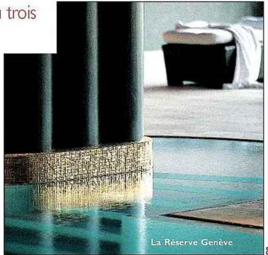
La Réserve Genève

D'étranges lampes en forme de méduses, des canapés blancs, des mosaïques de marbre, une piscine bleu nuit encadrée de colonnes de Macassar... Pas étonnant que le spa de l'hôtel La Réserve Genève ait été élu 2 e meilleur spa d'Europe en 2007. Un cocon luxueux de 2000 m 2 dédié au bien-être et signé du décorateur Jacques Garcia. Au bar-resto diététique, on boit un Swiss Bliss, cocktail énergétique (carotte, persil, citron, fenouil), suivi d'une salade japonaise aux concombres et algues wakamé. On se fait bichonner par une armée de thérapeutes (santé, nutrition, ostéopathie, beauté, détente) dans un nuage vaporeux de soins La Prairie et Cinq Mondes. Massages ayurvédiques, aux pierres chaudes, traitement détox... près de 50 soins différents. La Réserve Genève, c'est l'adresse chic sur le Léman. Le 1 er juin, un nouvel hôtel-spa La Réserve,