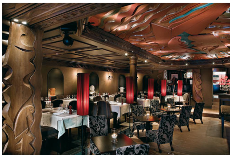
L'Hôtel Mont Blanc de Megève a réalisé de brillants travaux d'embellissement lui valant un surclassement.