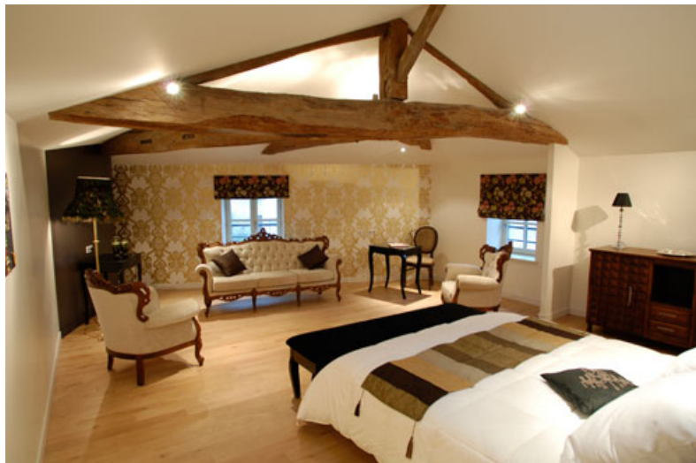
Le Frédéric Carrion Cuisine Hotel & Spa à Mâcon, référencé nouveau membre Argent.